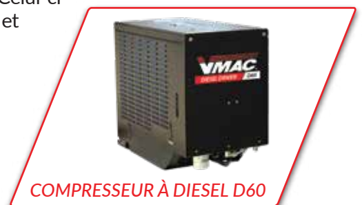
COMPRESSEUR À DIESEL D60