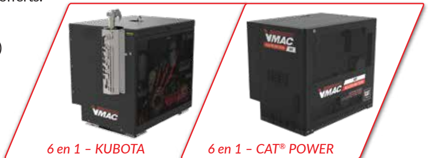
6 en 1 - KUBOTA